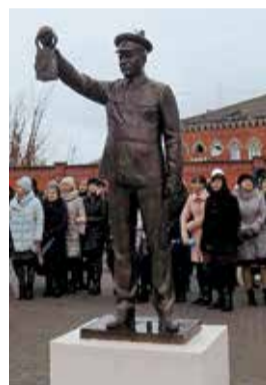
Часть мемориала – фигура стрелочника

Более двух месяцев два железнодорожника из Красноярска, перецепляясь от локомотива к локомотиву, в «окнах» интенсивного дорожного движения тянули экспонат от Красноярска до Сасово. Почти 4000 километров пути, неделя за неделей, они жили в паровозном тендере. Заросли бородами, их лица по-