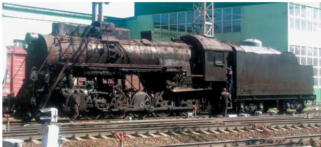
Старый паровоз готовили к установке умельцы ВЧДр Сасово. Новенький паровоз-памятник на постаменте!

В городе Сасово торжественно открыт Монумент славы железнодорожникам всех поколений. Основным объектом мемориала стал настоящий паровоз