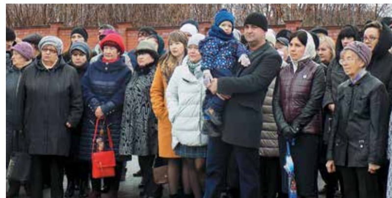
Главные участники открытия мемориала – жители Сасово, в основном семьи железнодорожников

темнели, но глаза и широкая сибирская улыбка просто светились: «С задачей справились!»