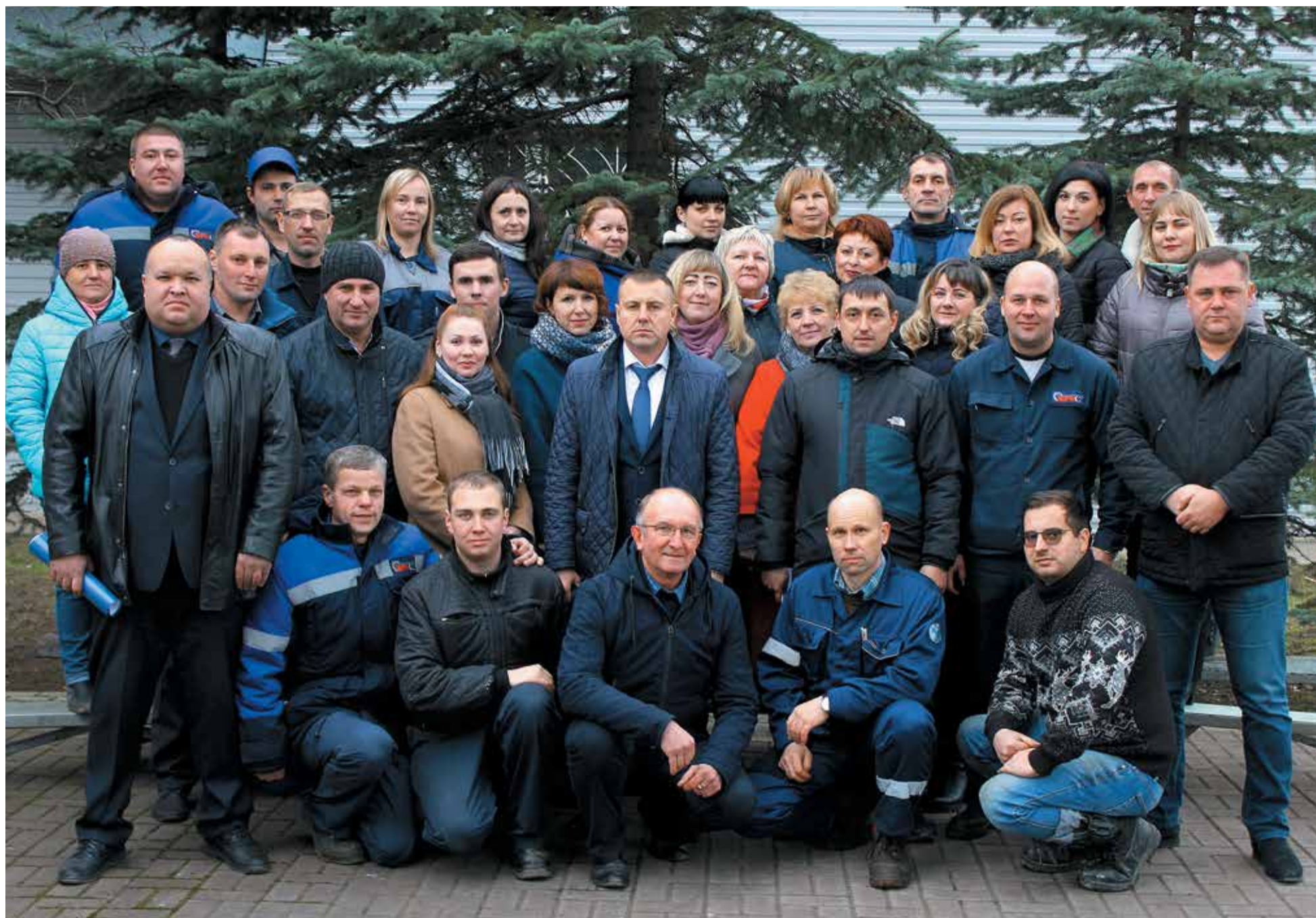
Трудовой коллектив вагонного ремонтного депо Волховстрой АО «ВРК-2» – лидер рейтинга по итогам 9 месяцев 2018 года. О делах и людях депо читайте на 2-й странице номера