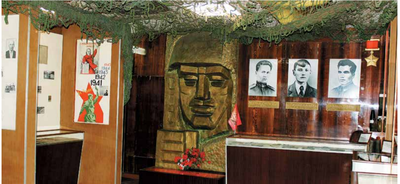
Редчайший, а возможно, уникальный случай: в депо Магнитогорск трое работников награждены высшим званием страны – Героя Советского Союза