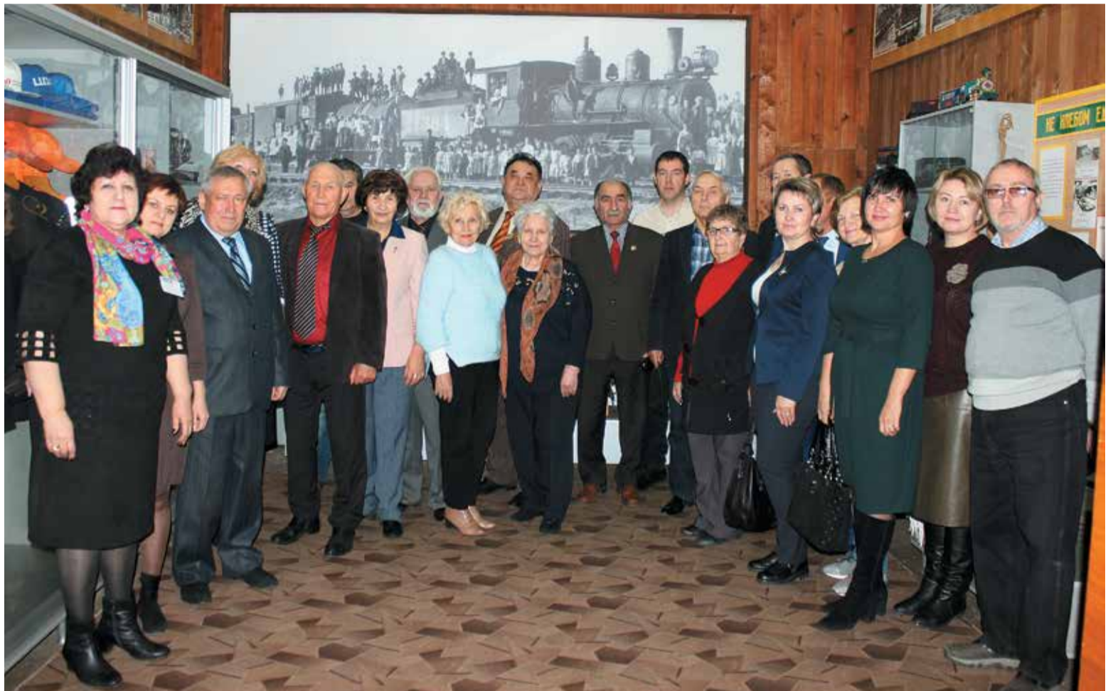
Высокую оценку работе музея дали члены президиума городского Совета ветеранов и представители других железнодорожных организаций Магнитогорска

о создании в школьных музеях экспозиций различных направлений – мемориального, экологического, патриотического, исторического и других.