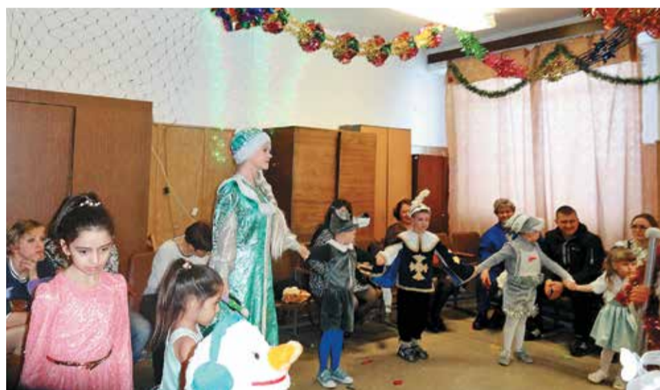
Традиционный детский хоровод у новогодней елки со Снегурочкой