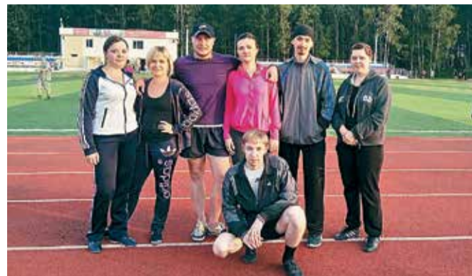
В Тынде спорт всегда в почете

Сегодня продолжим знакомство с молодыми, но уже крепкими профессионалами нашего общего дела. В рамках нашего путешествия мы все еще находимся на очень близком моему сердцу Дальнем Востоке. Герои прошлых публикаций в этой рубрике имеют полное право не только гордиться своими трудовыми достижениями, но и считать себя воспитателями молодой смены, о которой – в нашем первом номере 2017 года.