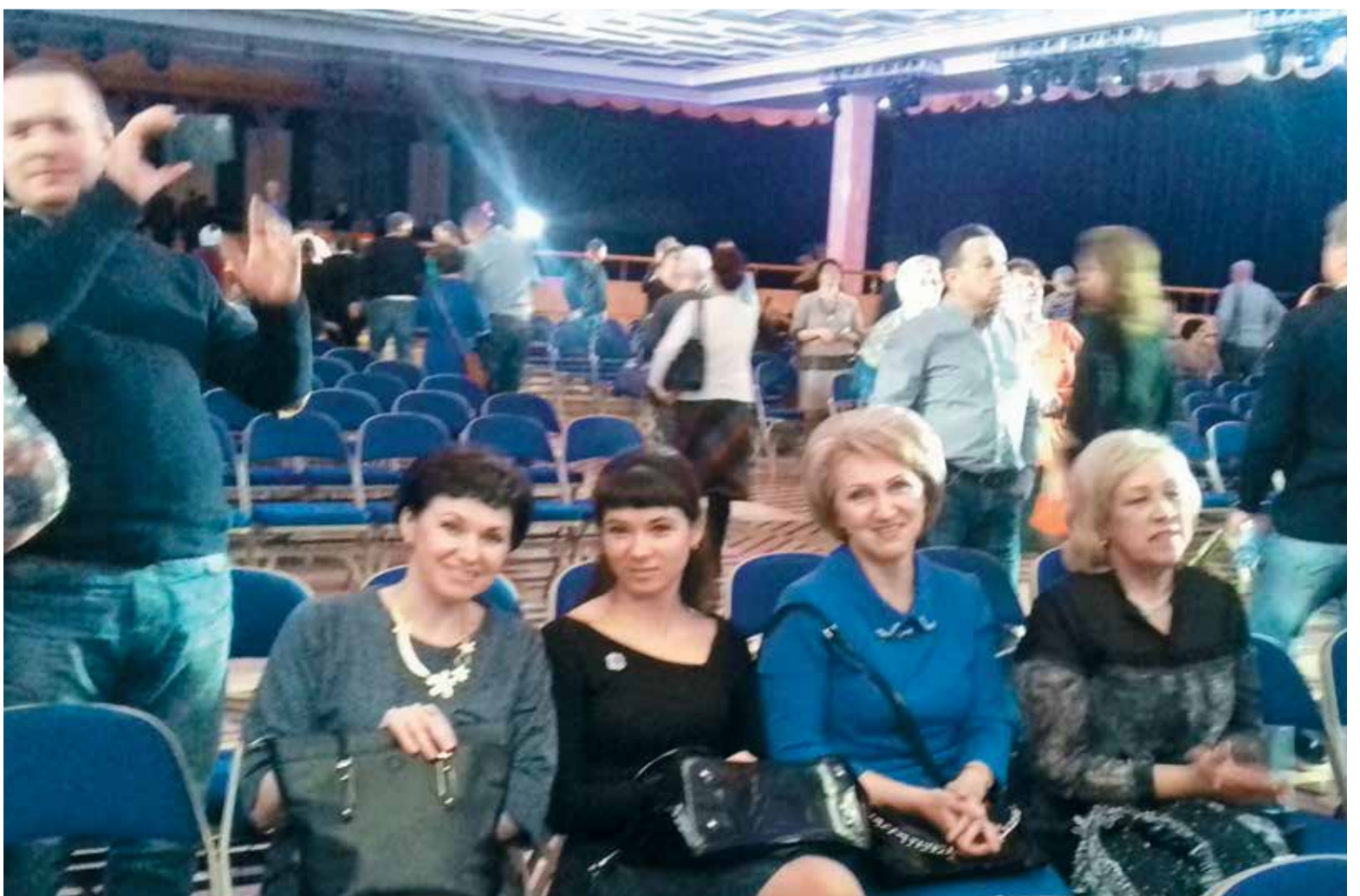
Прекрасное настроение у специалистов АО «ВРК-1» после последних музыкальных аккордов на культурном предновогоднем мероприятии, где среди зрителей было много коллег из трех вагоноремонтных компаний