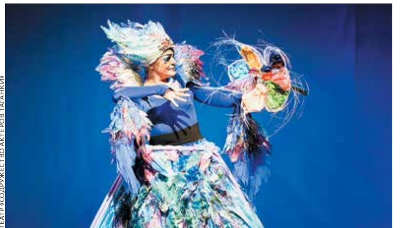
Сцена из музыкальной сказки «Тайна цветика-семицветика» (по знаменитому произведению Валентина Катаева «Цветик-семицветик»). Театр «Содружество актеров Таганки», 2016 г.