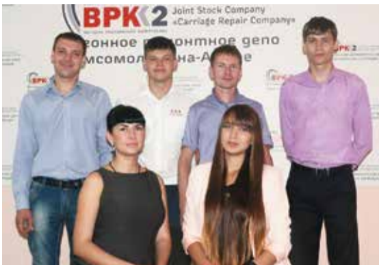
Наследники традиций Комсомольска-на-Амуре