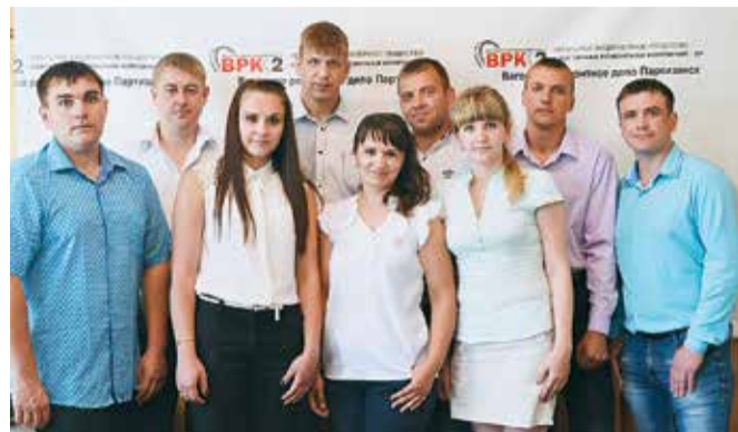
Заводная молодежь Партизанска

Традиции отцов и дедов – в умелых руках молодых вагонников-ремонтников