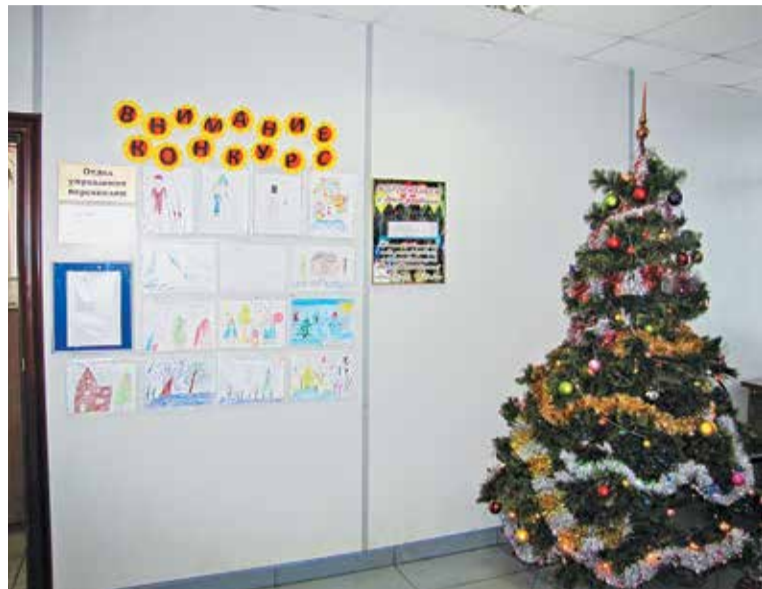
Детские рисунки отлично дополняли праздничный антураж

По доброй многолетней традиции в конце декабря в вагонном ремонтном депо Рыбное АО «ВРК-1» организуется детский праздник новогодней елки