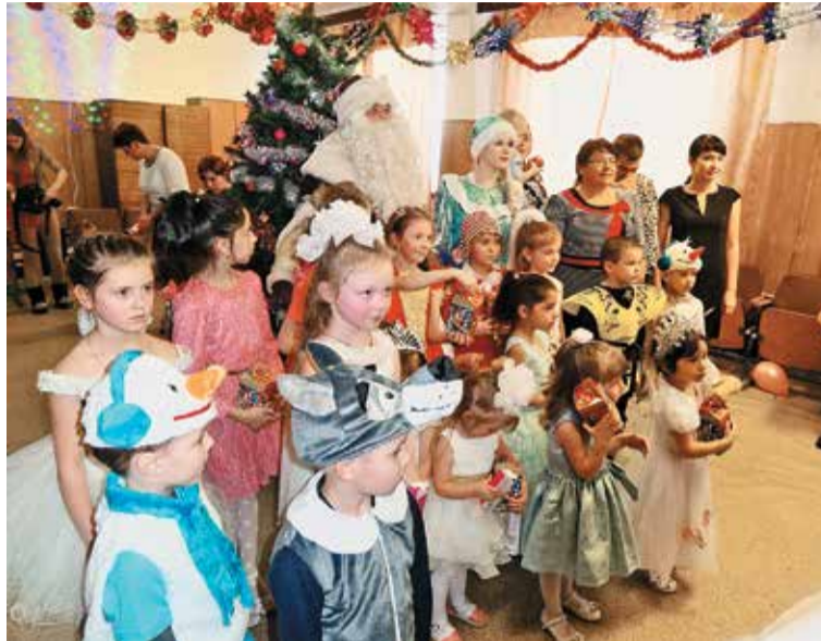
Мальчики в маскарадных костюмах и маленькие девочки-принцессы гармонично смотрелись с классическим Дедом Морозом и его окружением