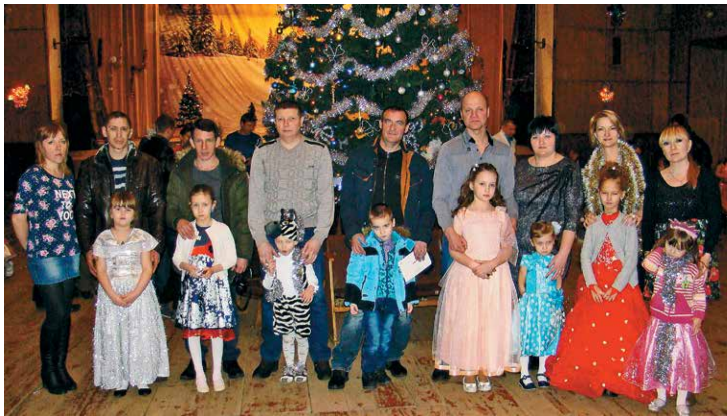
Нарядные мамы-папы и празднично-каранавальные дети из ВЧДр Сасово на новогодней елке 2016 года