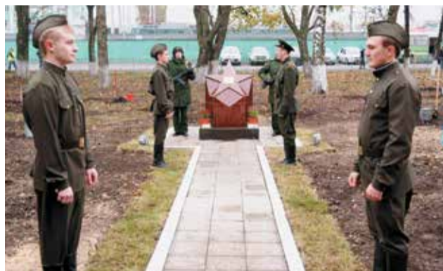
Сегодняшняя молодежь Курска помнит и чтит героических земляков – защитников города, отдавших жизни во имя потомков