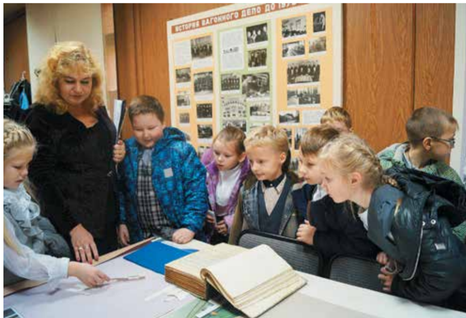
...и продолжилась в замечательном музее трудовой славы

году народный комиссар путей сообщения Ф.Э. Дзержинский отмечал большой успех тружеников Северной магистрали, в состав которой входило депо Вологда.