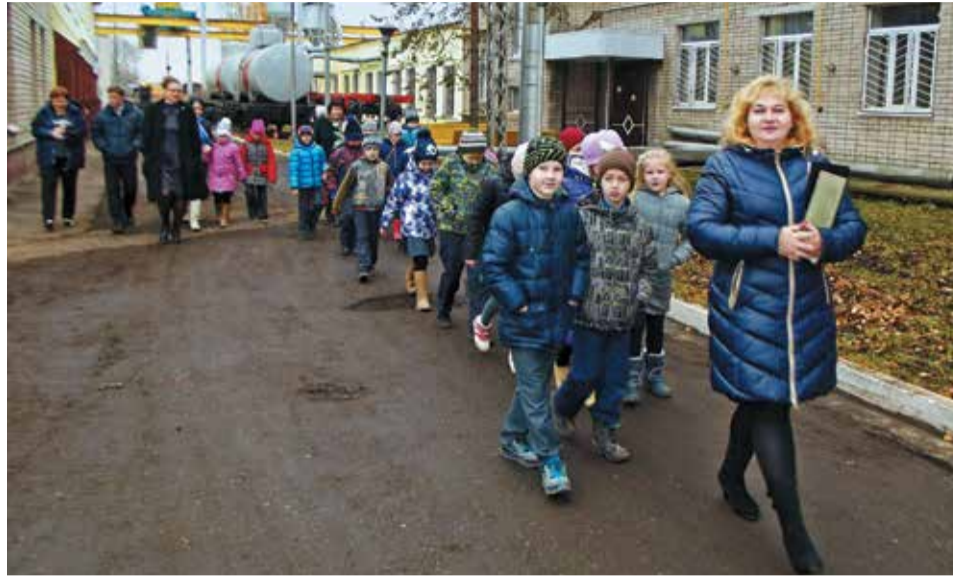
Экскурсия для любознательной детворы началась с территории депо...

Небольшая справка: вагонное депо Вологда – одно из старейших ж/д предприятий России. Уже в 1905 году была введена в эксплуатацию железнодорожная линия от Вятки до Санкт-Петербурга (1249 верст), проходящая через Вологду. 1913 год принято считать годом основания вагонного депо Вологда. Трудники депо приложили много усилий для организации перевозки грузов в период Октябрьской революции и Гражданской войны. Большую услугу оказали вологжане голодающим Поволжья. Подвижной состав для «хлебных» поездов ремонтировался и восстанавливался в вагонном депо Вологда. В 1928