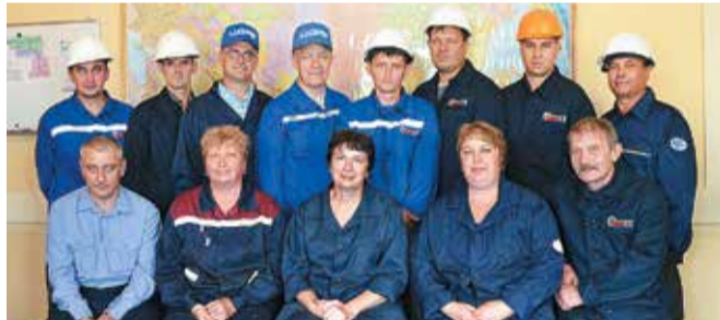
Передовики вагонного ремонтного депо Партизанск

Практически во всех депо АО «ВРК-2» трудились и трудятся люди, для которых выбор профессии определил всю жизнь. О них рассказывает в своем авторском цикле И.А. Малькина