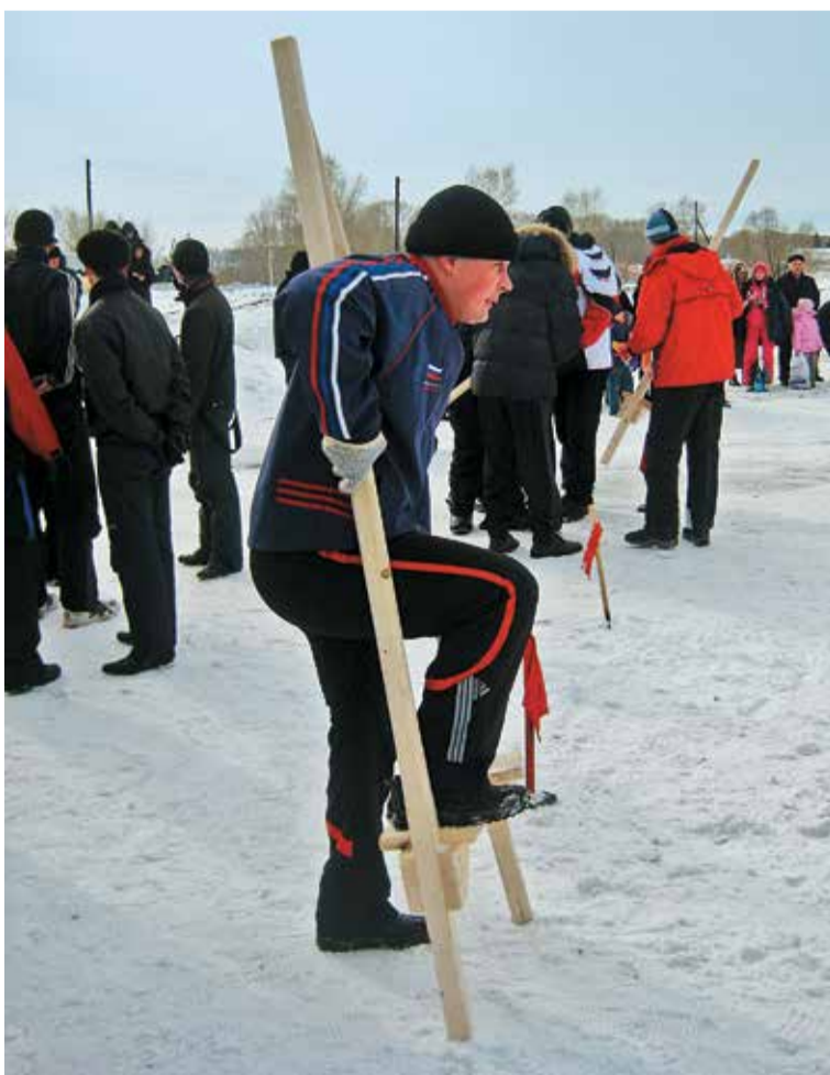
Без труда не вынешь рыбку из пруда!