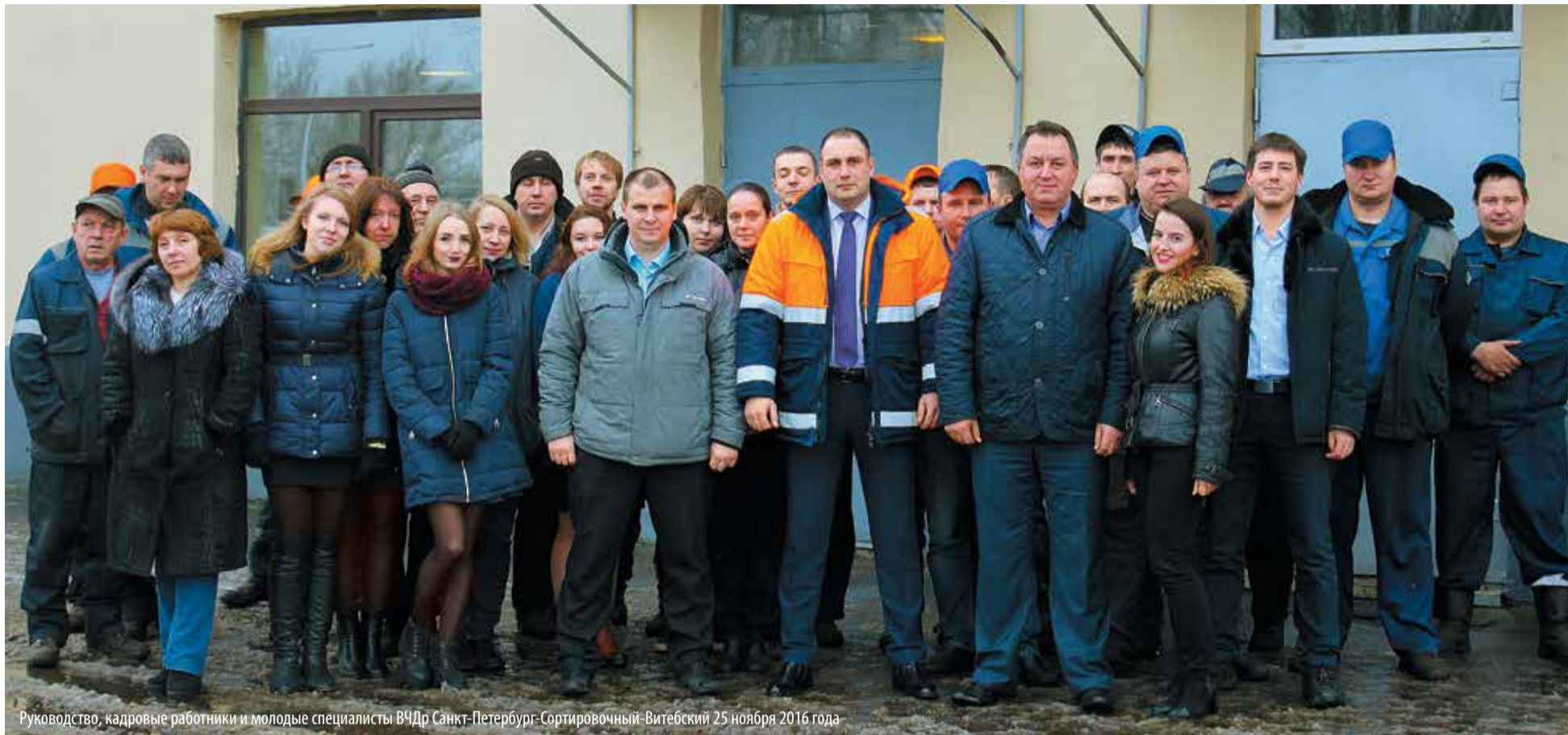
Руководство, кадровые работники и молодые специалисты ВЧДр Санкт-Петербург-Сортировочный-Витебский 25 ноября 2016 года