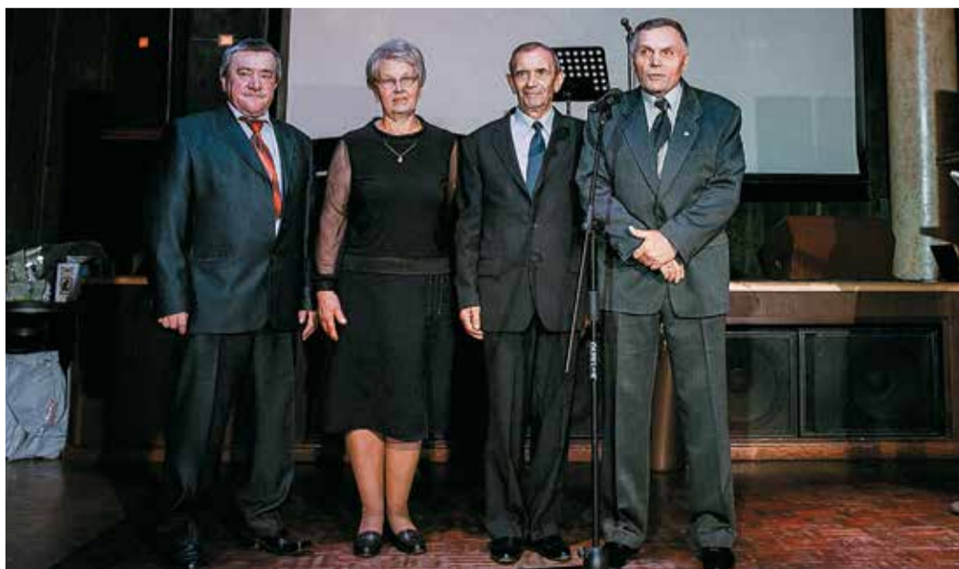
Ветераны депо поздравляют младших коллег с общим юбилеем!