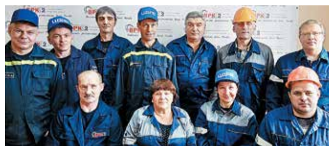
Передовики вагонного ремонтного депо Тынды