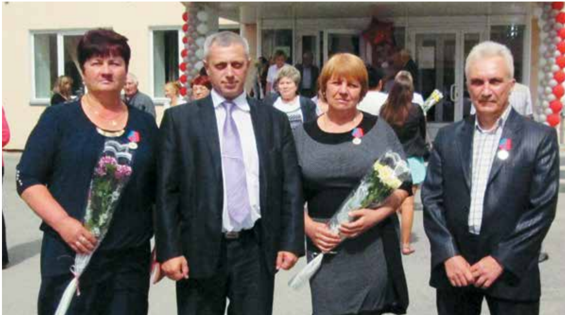
Начальник депо с лауреатами областной награды Кузбасса