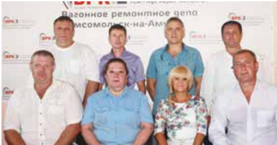
Передовики вагонного ремонтного депо Комсомольск