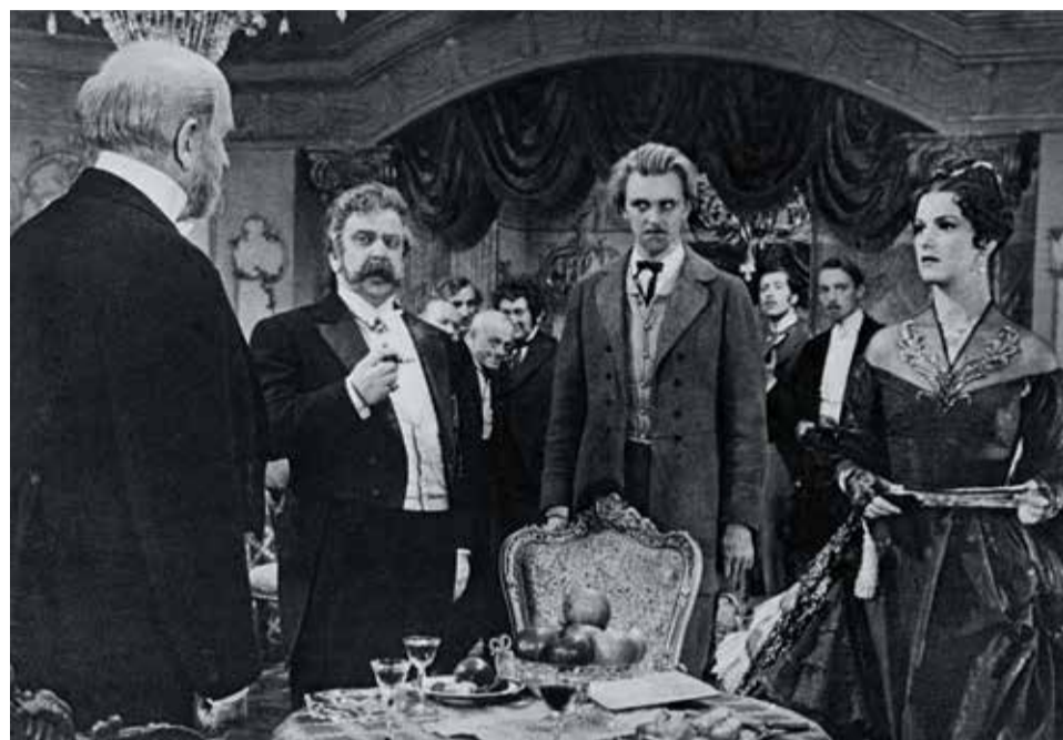
Народные артисты СССР Юлия Борисова и Юрий Яковлев в фильме «Идиот» режиссера И. Пырьева, 1958 год